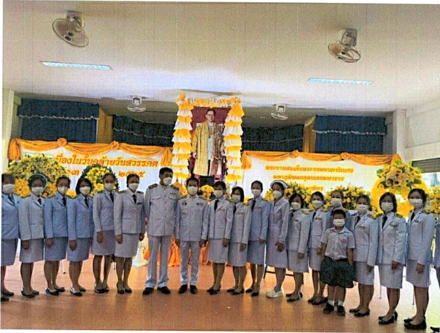
ร่วมกิจกรรมเทิดทูนสถาบัน